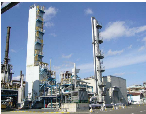
工業ガス製造設備