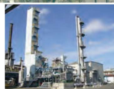
工業ガス製造設備